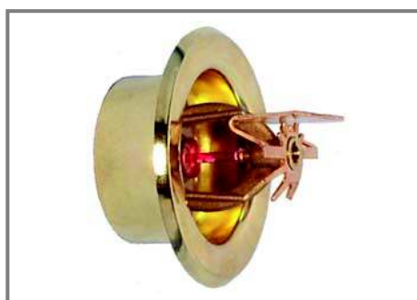
Empotrado Horizontal de pared