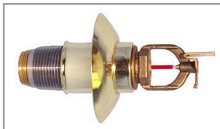
Camisa y aleta tipo seco horizontal de pared