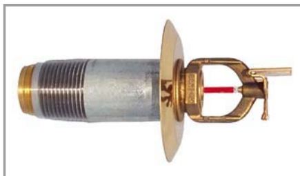
No regulable tipo seco horizontal de pared