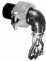
CODO DE REDUCCIÓN DE 90° SE-5 Ranura x Rosca