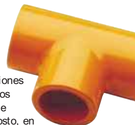
Dimensiones y pesos de la tubería IPEX BlazeMaster SDR 13.5 (ASTM F 442)

La tubería y conexiones BlazeMaster ofrecen una combinación sin paralelo de características y soporte para todas los requerimientos de construcciones de bajo riesgo. Los sistemas son más fáciles y menos caros que los metálicos para instalarse, virtualmente libres de mantenimiento y efectivos en cuanto al costo, en ambos—construcciones nuevas y remodelaciones. Haga la elección correcta para su proyecto. Elija la tubería y conexiones BlazeMaster.